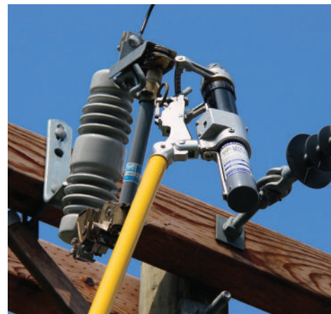
Figura 2 - Sujutando el XLT