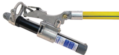
Figura 1 - Instalación en pértiga